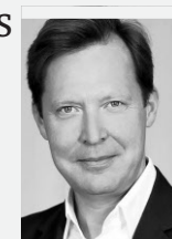
MEDWED PEOPLE | REMATE MEDWED

Nur qualitatives Wirtschaftswachstum ist langfristig erstrebenswert – die Vermehrung des Wohlstandes einer Gesellschaft ohne Ausbeutung. Dazu braucht es gut ausgebildete Beschäftigte, ausreichend Kapital und technologische Innovation. Cloud – als Teil der digitalen Revolution – ist eine solche Innovation. Sie steht Klein- und Mittelunternehmen (KMU) leicht zur Verfügung. Benötigt wird dabei der eindeutige Wille, sich mit Cloud Computing ernsthaft zu beschäftigen. Das bekämpft schlechte BIP Zahlen, steigende Verschuldung sowie Arbeitslosigkeit und schafft zudem erfolgreiche Unternehmen.