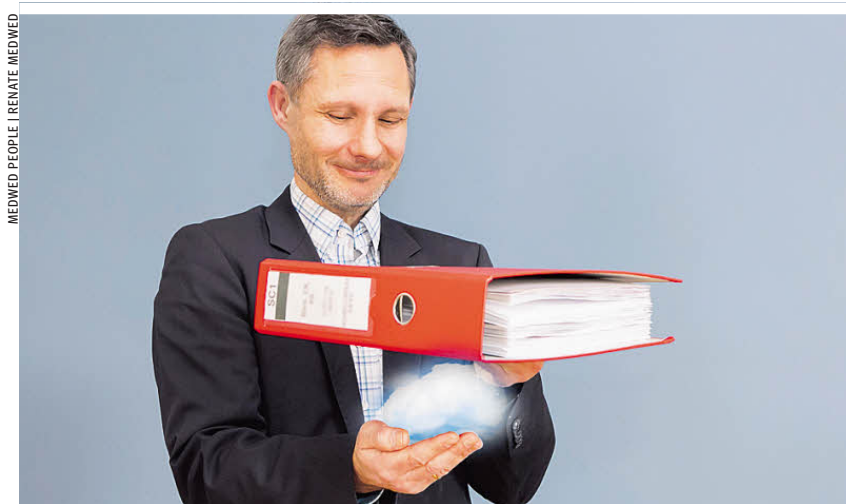
MEDWED PEOPLE | REMATE MEDWED